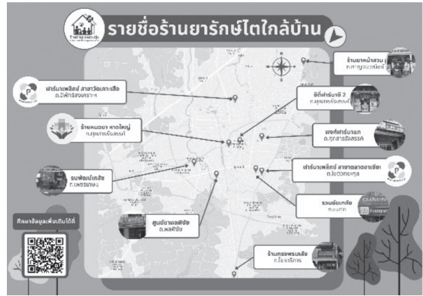
รูปแสดง เครือข่ายร้านยารักษ์ใต้ พื้นที่ภาคใหญ่ 10 ร้านยา

สมาคมเภสัชกรรมชุมชน (ประเทศไทย) จากการดำเนินโครงการต่อเนื่องในปี 2565 เพื่อส่งเสริม เภสัชกรชุมชนให้มีเครื่องมือช่วยดำเนินงานในการการรายงานเหตุการณ์ไม่พึงประสงค์จากการใช้ยา และผลิตภัณฑ์ที่ไม่ปลอดภัย รองรับการให้บริการทางเภสัชกรรมตามมาตรฐาน GPP หรือแนวทางร้านยาคุณภาพ รวมทั้งสร้างเครือข่ายเภสัชกรชุมชน ในการรายงานเหตุการณ์ไม่พึงประสงค์จากการใช้ยา หรือผลิตภัณฑ์สุขภาพที่ไม่ปลอดภัยที่พบในชุมชน เสริมศักยภาพด้านวิชาการการรายงานเหตุการณ์ไม่พึงประสงค์จากการใช้ยา หรือผลิตภัณฑ์ การประเมินเหตุการณ์ การจัดการปัญหาดังกล่าว โดยมีหลักฐานวิชาการรองรับ นำไปสู่แนวทางการปฏิบัติที่ดี ในการจัดการเหตุการณ์ไม่พึงประสงค์ และ สร้างกระบวนการส่งต่อในชุมชนผู้รายงาน เชื่อมโยงข้อมูลจากเหตุการณ์ไม่พึงประสงค์ที่พบในร้านยา ไปยังโรงพยาบาล หน่วยงานที่รับผิดชอบเกิดการกระบวนการแก้ปัญหาอย่างเป็นรูปธรรม ระยะเวลา ดำเนินงานตั้งแต่ ปี 2565 ถึง พฤษภาคม 2566 ได้สร้างเครือข่ายเภสัชกรชุมชน “ตาไว” ในการเฝ้าระวังการใช้ผลิตภัณฑ์สุขภาพที่กระจายตัวตามเขตสุขภาพ 12 เขตทั่วประเทศ จำนวน 207 ร้าน จัดการประชุมวิชาการ 4 ครั้ง มีเภสัชกรผ่านการอบรมเกี่ยวกับกระบวนการ ดักจับ เฝ้าระวังปัญหาการใช้ยาและผลิตภัณฑ์ทั้งสิ้น 650 คนได้รับการรายงานการใช้ผลิตภัณฑ์ ทั้งหมด 88 ฉบับ รายงานโฆษณาเกินจริง 41 (46.59%) รายงานผลิตภัณฑ์ต้องสงสัย 22 (25%) และ รายงานผลิตภัณฑ์ต้องสงสัยในร้านยา 25 ราย (28.41%)